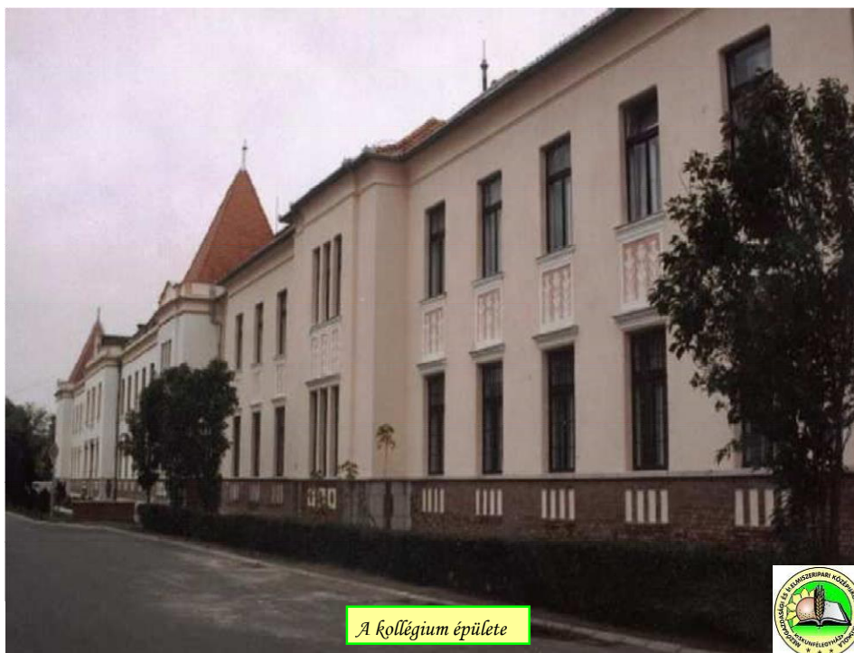
A kollégium épülete