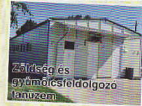
Zöldség és gyümölcsfeldolgozó tanüzem