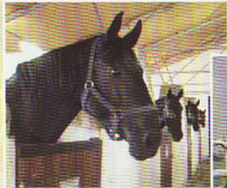
Lóistálló és lovak